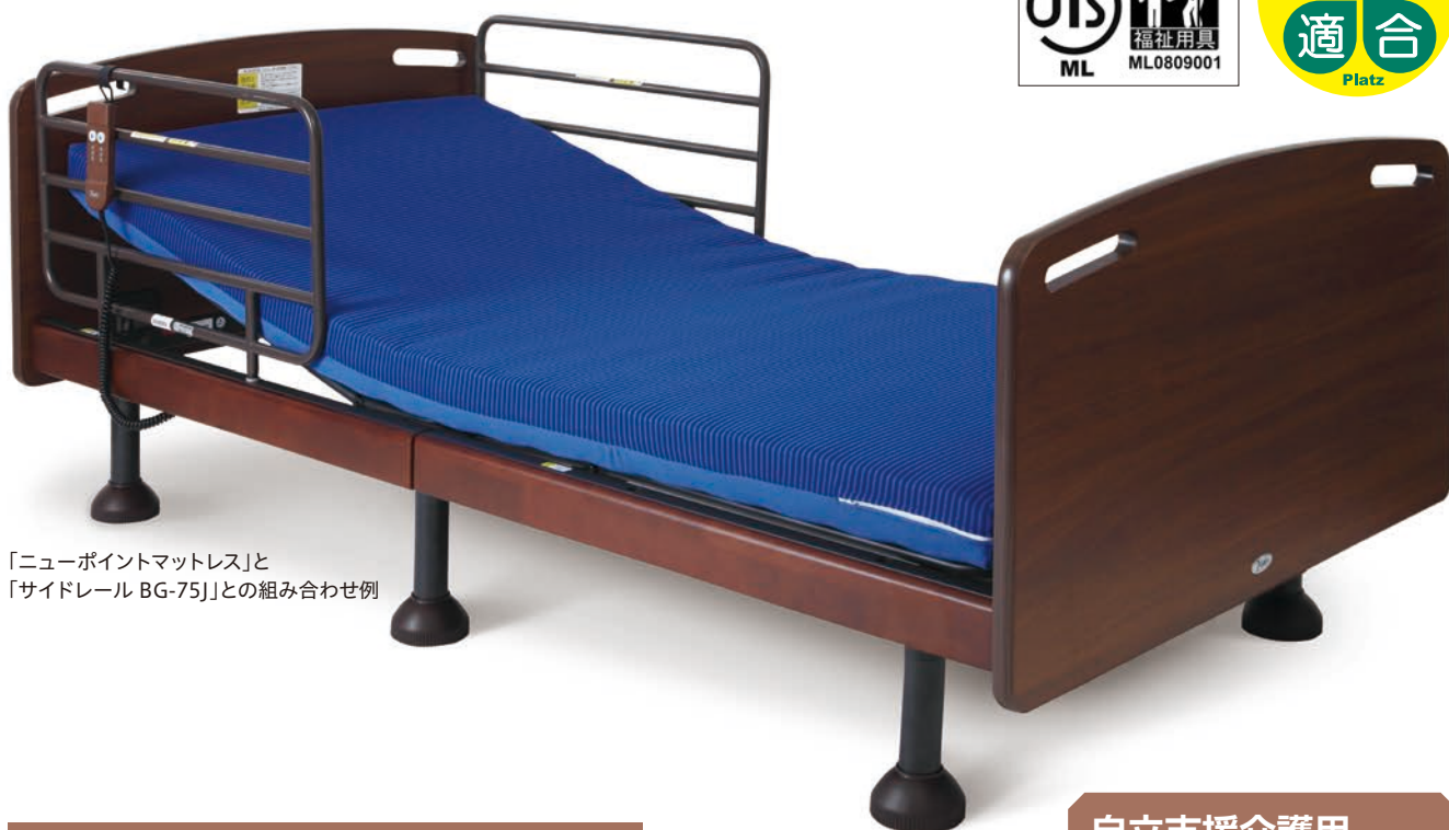
「ニューポイントマットレス」と 「サイドレール BG-75」との組み合わせ例