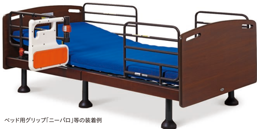
ベッド用グリップ「ニーパロ」等の装着例

在宅介護用ベッドの JIS規格 (JIS T 9254:2009) の認証取得品です