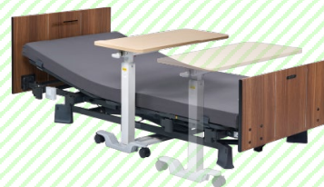
サイドテーブルや、ハイトスペー サー仕様ではリフト・お掃除ロ ボットも使用できる