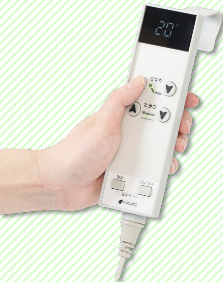
操作ロック機能を搭載、防水性能も向上した 表示パネル付き手元スイッチ